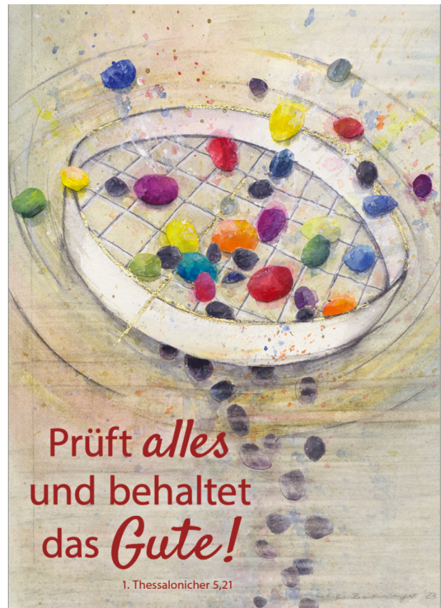
Bildmotiv von Stefanie Bahlinger, Mössingen, www.verlagambirnbach.de

„Also“, sagte lächelnd der Weise, „wenn es weder wahr noch gut noch notwendig ist, so lass es begraben sein und belaste dich und mich nicht damit.“