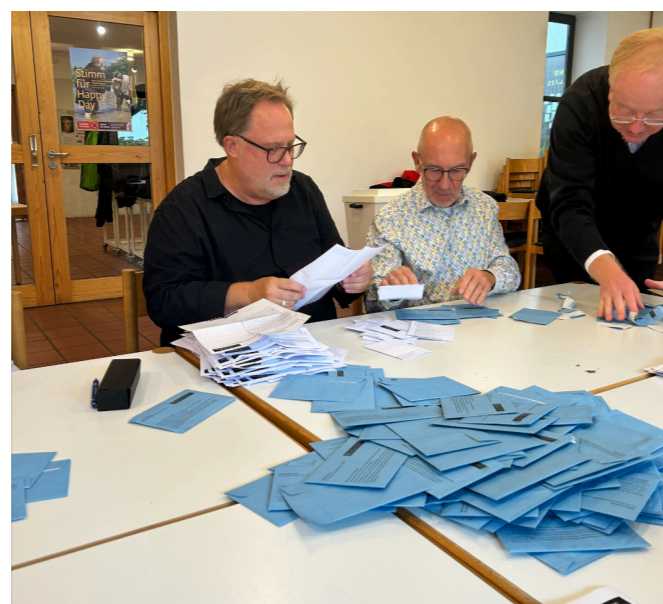
410 Wahlbriefe gingen ein und mussten vor der Wahl erst einmal geöffnet und auf Gültigkeit überprüft werden.