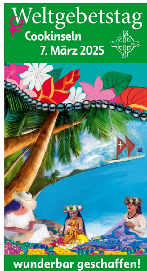
© 2023 World Day of Prayer International Committee, Inc.

Die Verfasserinnen der Liturgie laden dazu ein, dem Klang des Meeres und dem Wunder der Schöpfung nachzuspüren und dadurch auch zu erkennen, wie bedroht sie ist. Vielleicht sind die wertvollen schwarzen Perlen, die hier gezüchtet werden, ein Sinnbild dafür: Die Kostbarkeit der Schöpfung muss entdeckt werden. Sie kann existenzsichernd oder bedroht sein. Aber sie ist auch gefährdet, wenn sie die schützenden (Muschel-) Schalen verliert. Deshalb geht es darum, „mit unseren Gaben und Talenten der Welt zu dienen und zum Segen zu werden“, wie es im Gottesdienst heißt.